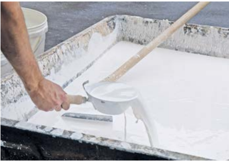
Der Branntkalk wurde gelöscht: Basis für weitere Gewerke

Der gewonnene Kalk wird vielfältig verwendet. Der Kalk aus Sur En da Sent gilt als nachhaltiges Baumaterial, das vor Ort produziert und von Hand hergestellt wird. Kalk hat hervorragende Eigenschaften, wie z.B. seine ökologische Verträglichkeit, Langlebigkeit und seine Fähigkeit, Feuchtigkeit zu regulieren und die Luft zu reinigen. Diese Eigenschaften machen diesen Kalk zu einem beliebten Material für ökologisches Bauen und den Erhalt historischer Bausubstanz.