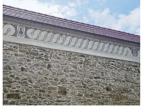
Sgraffito in Kalk – häufig zu sehen im Engadin

beiteten Kalks darstellen. Vom Rauputz bis hin zu glatten Oberflächen oder Sgraffito, dem Kratzmuster zur Dekoration von Kalkputz.