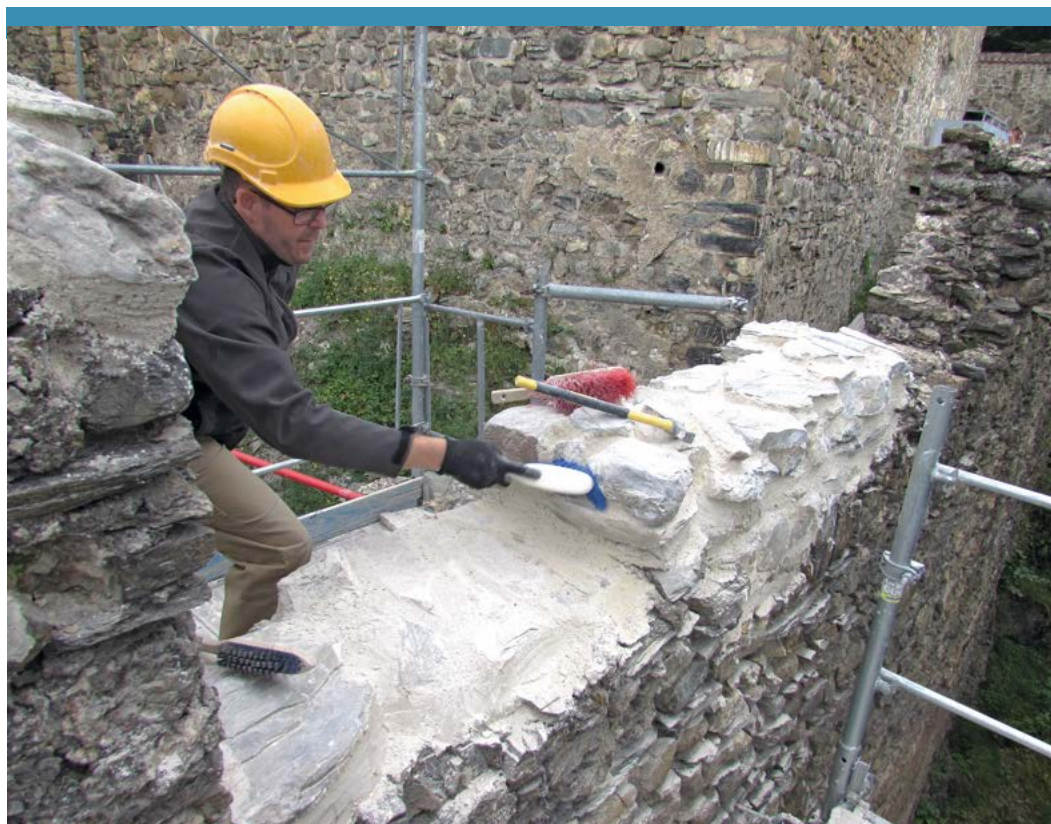
Bruder Franz am Finish der Mauerkrone.