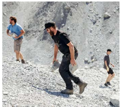
Kalkstein sammeln im Val Trigl, Engadin