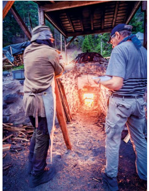
Die Brandhut hält den Brand während einer der Nachtschichten.

se faszinierende Technik und die Geschichte der Region interessieren. Der Prozess des Kalkbrennens ist eine beeindruckende Mischung aus Tradition und handwerklichem Können – eine Kunst, die tief in der Geschichte des Engadins verwurzelt ist und deren Wissen es zu bewahren gilt.