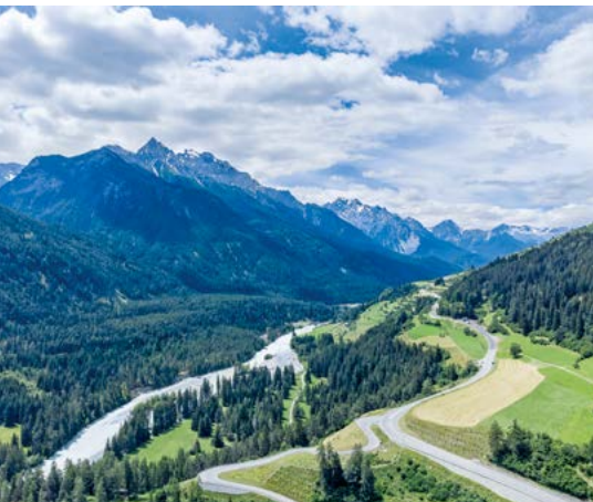
Das Inntal im Engadin, links ist das Tal Val d'Uina zu erahnen