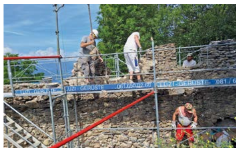
Allein schon das Bereitstellen von geeigneten Bruchsteinen auf dem Gerüst erfordert einige Man-Power.