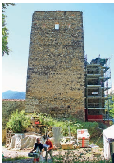
Der Turm von Neu-Aspermont mit dem eingerüsteten Nordpalas.

Während es unten im Dorf Jenins bei über 30 Grad Celsius drückend heiss ist, wird die Luft auf dem steilen Burgweg hinauf durch den