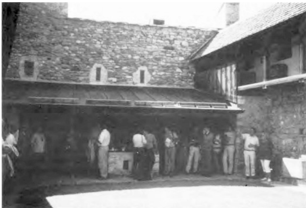
Generalversammlung 1993: Die stattliche Schar zu Gast auf Haselstein, hier im lauschigen Burghof

die Absicht, die Burg sinnvoll zu nutzen. Es ist vorgesehen, jemanden als Burgwart zu bestimmen, denn die Anlage sollte für verschiedene Vereinsanlässe oder für andere Zusammenkünfte gemietet werden können. Man möchte so Leute auf eine Burg bringen, die bis jetzt noch kein Interesse an Burgen oder Ruinen haben, und hofft dadurch Verständnis für deren Erhaltung zu wecken. Mit den heutigen Bestimmungen ist es sehr schwierig, eine Bewilligung für so eine Nutzung zu bekommen, doch scheinen Gemeinde und Kanton gewillt, eine beschränkte Nut-