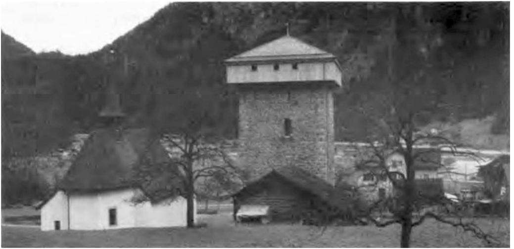
Der Meierturm von Silenen im Kanton Uri hat vor wenigen Jahren seinen ursprünglichen Obergaden von neuem erhalten; Rekonstruktion aufgrund der Baubefunde.

Trockemauerwerk: sorgfältig geschichtetes Mauerwerk ohne Mörtel, oft für Umfassungsmauern (Heinzenberg) und kleinere Bauten innerhalb eines Burgareals verwendet