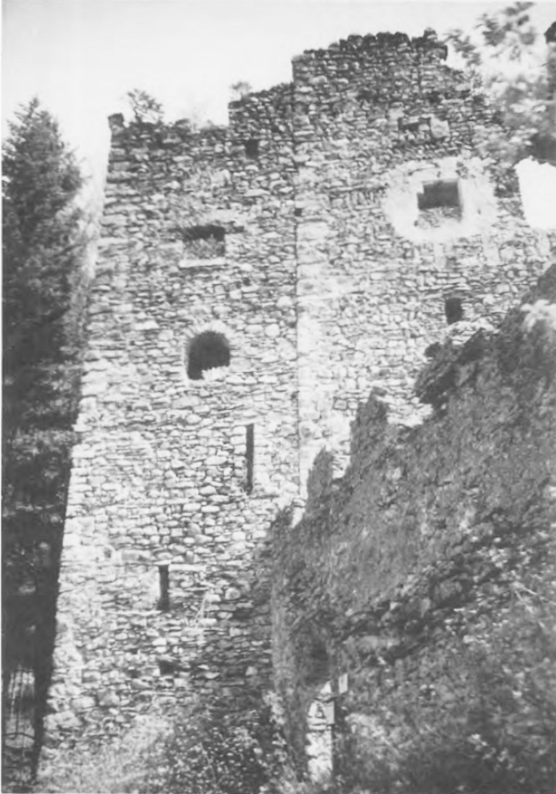
Älterer (rechts) und jüngerer (links) Palas samt zinnengekröntem Bering der mächtigen Anlage Neuspermont ob Jenins, Ansicht von Westen

Dieses Jahr führt unsere Burgenexkursion als Tagesfahrt in die Bündner Herrschaft.