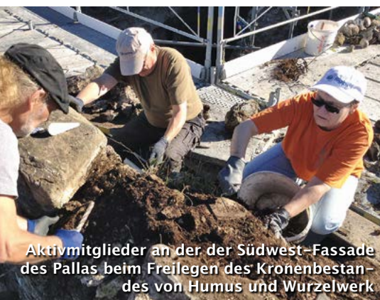
Aktivmitglieder an der der Südwest-Fassade des Pallas beim Freilegen des Kronenbestan- des von Humus und Wurzelwerk