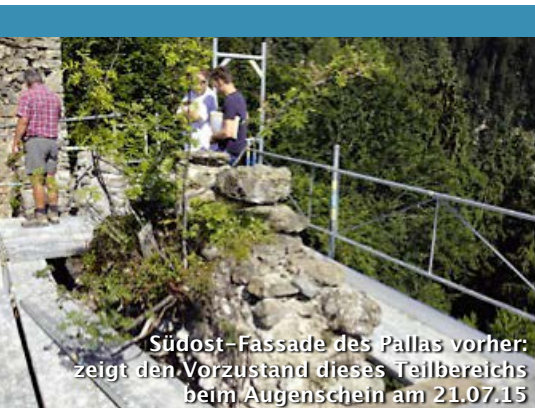
Südost-Fassade des Pallas vorher: zeigt den Vorzustand dieses Teilbereichs beim Augenschein am 21.07.15