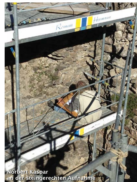
Norbert Kaspar an der steingerechten Aufnahme