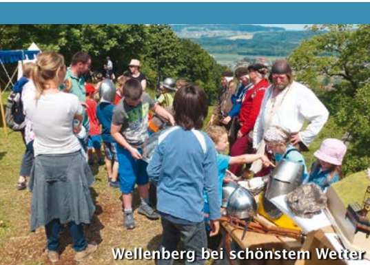
Wellenberg bei schönstem Wetter

Auch 2014 durften wir an drei Anlässen teilnehmen.