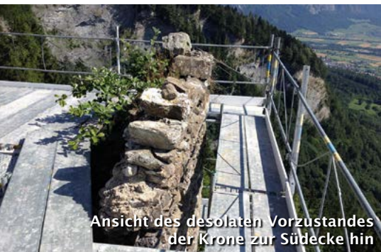
Ansicht des desolaten Vorzustandes der Krone zur Südecke hin

Am Mittwochmorgen erhielten wir Besuch vom Vertreter der Denkmalpflege, von den baubegleitenden Architekten und vom Burgverein Neu-Aspermont. In konstruktiven und einvernehmlichen Gesprächen konnte die Art und Weise der nächsten Arbeitsschritte besprochen und festgelegt werden.