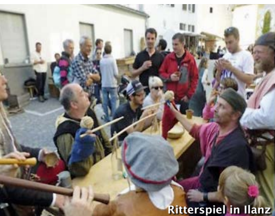
Ritterspiel in Ilanz

In jedem Jahr darf sich ein Verein oder eine Firma am Herbstmarkt der Arbes Rothenbrunnen präsentieren. Letztes Jahr wurde der Burgenverein Graubünden dafür eingeladen. Dieser Einladung sind wir natürlich gerne gefolgt, haben wir doch eine lange Beziehung zu Rothenbrunnen.