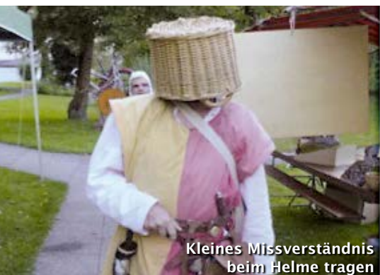
Kleines Missverständnis beim Helme tragen

Auf Schloss Wellenberg war am 24. und 25. Mai wieder einiges los. Von den Römern bis zu der Bündner Artillerie aus dem 19. Jahrhundert war hier so ziemlich alles präsent. So gab es auch für uns wieder viel zu bestaunen.