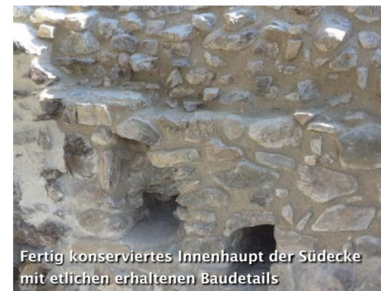
Fertig konserviertes Innenhaupt der Südecke mit etlichen erhaltenen Baudetails