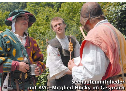
Seehaufennmitglieder mit BVG-Mitglied Hucky im Gespräch