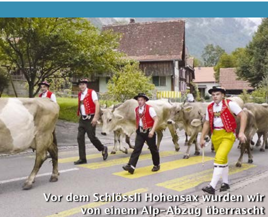
Vor dem Schlössli Hohensax wurden wir von einem Alp-Abzug überrascht