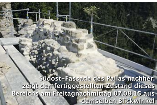
Südost-Fassade des Pallas nachher: zeigt den fertiggestellten Zustand dieses Bereichs am Freitagnachmittag 07.08.15 aus demselben Blickwinkel