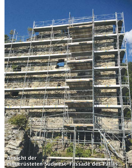
Ansicht der eingeringelten Südwest-Fassade des Pallas

Einer schönen und generösen Tradition folgend, belieferte uns am Dienstagmittag unser Mitglied Andreetta