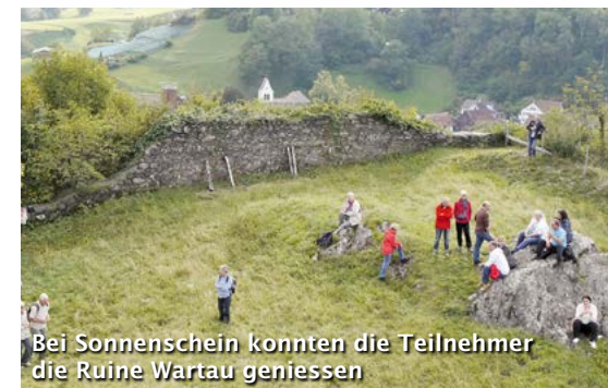
Bei Sonnenschein konnten die Teilnehmer die Ruine Wartau geniessen