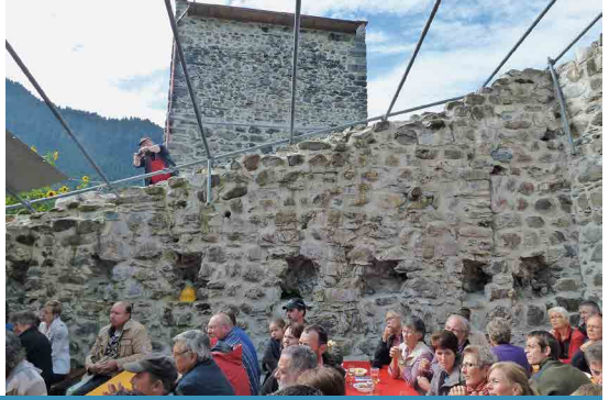
Impressionen Eröffnung Burg Strahlegg 15.9.13