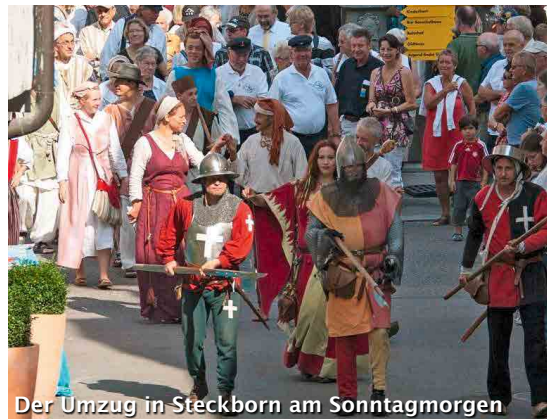
Der Umzug in Steckborn am Sonntagmorgen