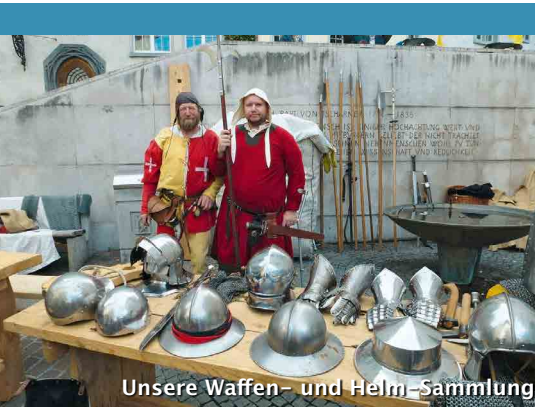
Unsere Waffen- und Helm-Sammlung