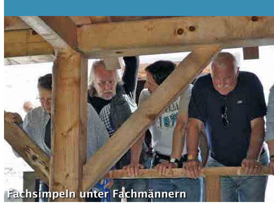
Fachsimpeln unter Fachmännern