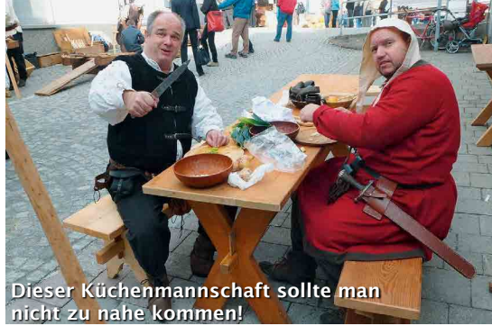
Dieser Küchenmannschaft sollte man nicht zu nahe kommen!