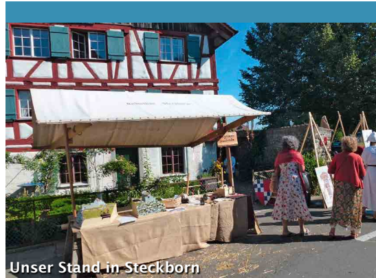
Unser Stand in Steckborn

Im Herbst wurde das zweite Spectaculum in Curia durchgeführt. Ein Anlass, der leider nicht von Anfang an unter einem guten Stern stand. Nachdem der Hauptsponsor abgesprungen war, konnte der