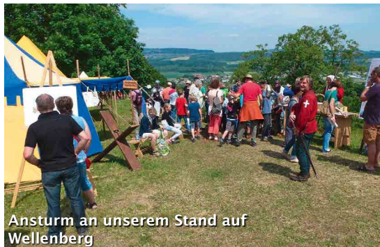
Ansturm an unserem Stand auf Wellenberg