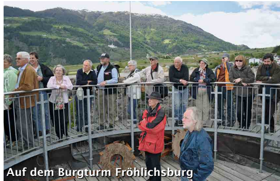
Auf dem Burgturm Fröhlichsburg