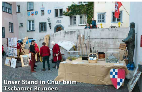
Unser Stand in Chur beim Tscharner Brunnen