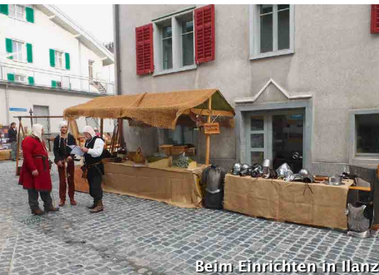
Beim Einrichten in Ilanz