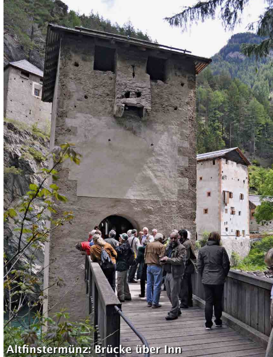
Altfinstermünz: Brücke über Inn

Den runden Burgturm Fröhlichsburg konnten nicht alle bis auf die Zinnen besteigen. Im Innern ist eine imposante, hölzerne Treppenanlage eingebaut worden. Diese ist zwar sehr sicher, aber nur für schwindelfreie Leute geeignet. Ein junger Historiker gab uns einen äusserst spannenden Einblick in die Geschichte des Vinschgau und der Fröhlichsburg. Dank des hervorragend schönen Wetters konnten wir weit in die Talschaft blicken mit dem Städtchen Glurns, Ruinen, Schlössern und Festungen. Der Rundturm war durch zwei durchgehende, armdicke Risse arg gefährdet und wurde in den vergangenen Jahren gesichert.